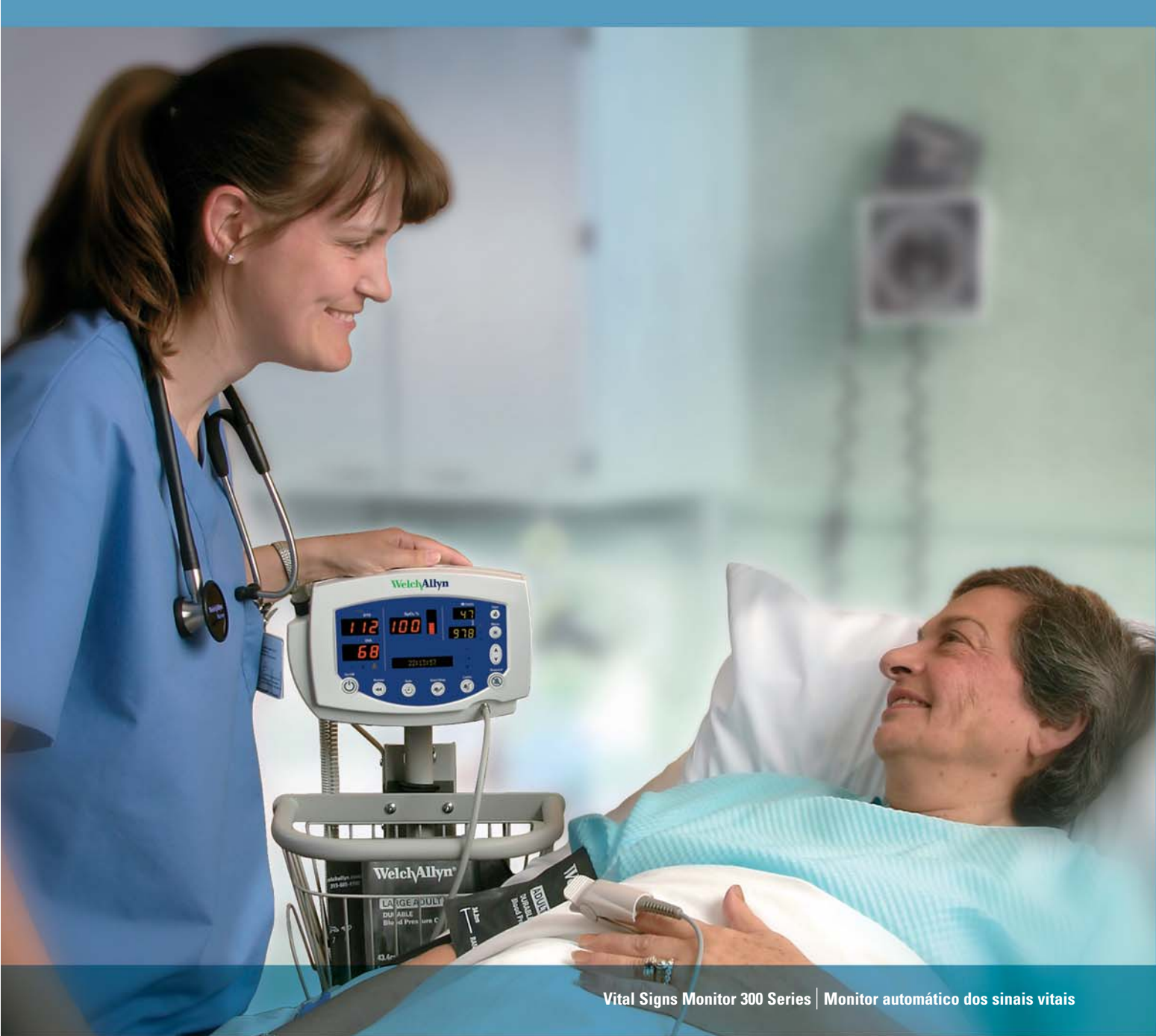
Vital Signs Monitor 300 Series | Monitor automático dos sinais vitais